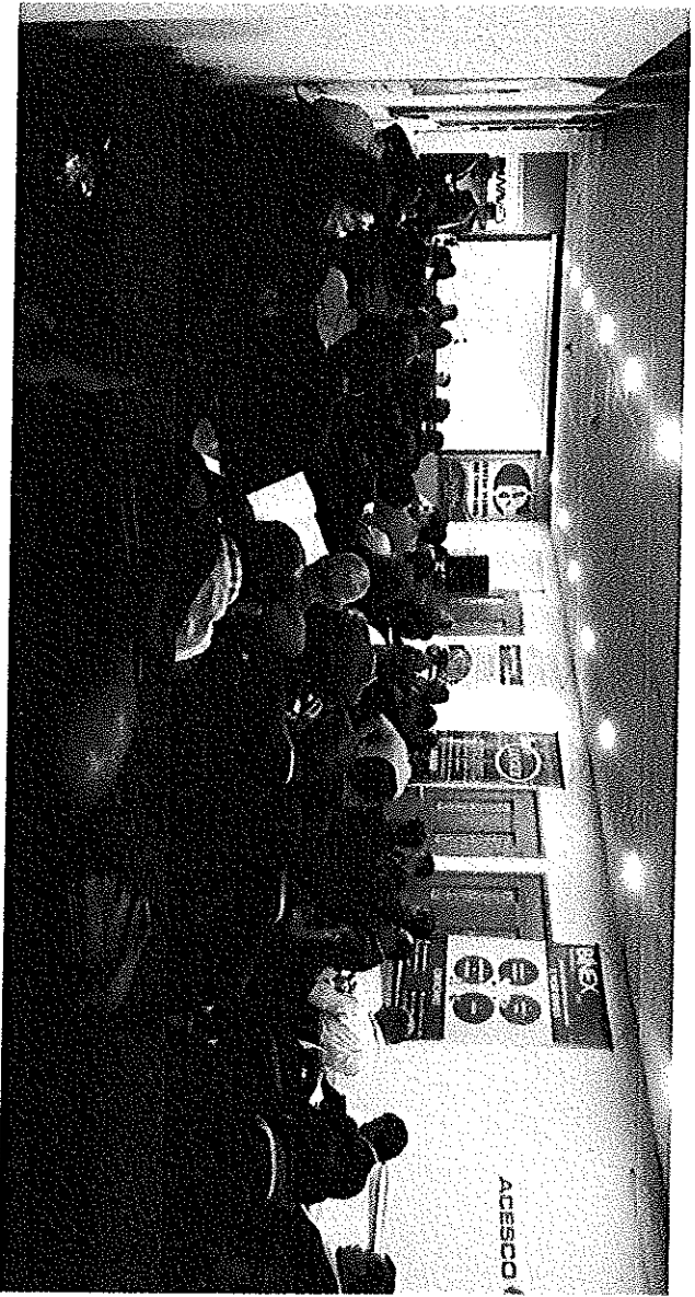
TERCER OFERTON . En octubre, promovió una reactivación del sector.